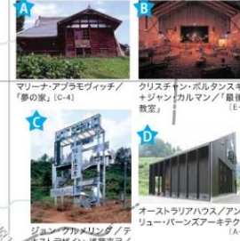
マーナ・アラモヴィッチ / 「夢の家」(C-4) クリステン・ホルクスナー / ジェーン・カルマン / 「最後の教室」(E-4) ジュン・クワム・ソン / 「チキニストデザイン・滝葉クロノ・スタックインフラ」(C-1) オーストラリアハウス / アンドリュー・バーンスアーキテクト (A-4)

越後妻有 大地の芸術祭の里 3年に一度越後妻有地域(十日町市・津南町)にて開催される、現代アートの祭典「大地の芸術祭 越後妻有アートトリエンナーレ」の舞台となっています。 ●詳しくは、大地の芸術祭の里総合案内所 ☎025-761-7767へお問い合わせ下さい。