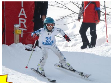
地元コーチ勢に見守られ 緊張のスタート 頑張れ～！！