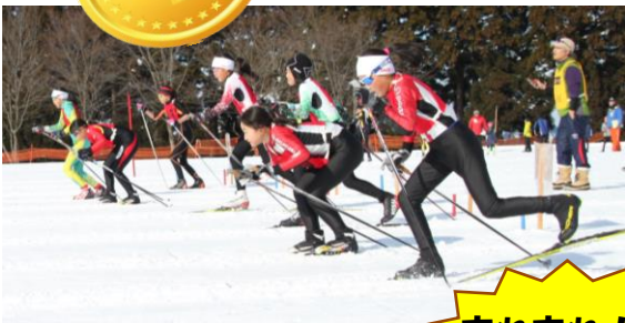
リレースタートの光景 選手が一斉に走り抜けるさまは 大迫力です！