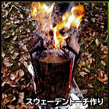
スウェーデントーチ作り