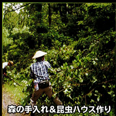
森の手入れ&昆虫ハウス作り