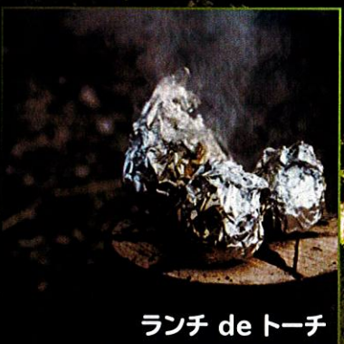
ランチ de トーチ