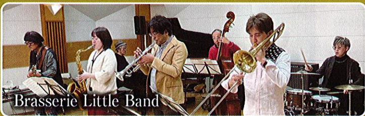
Brasserie Little Band